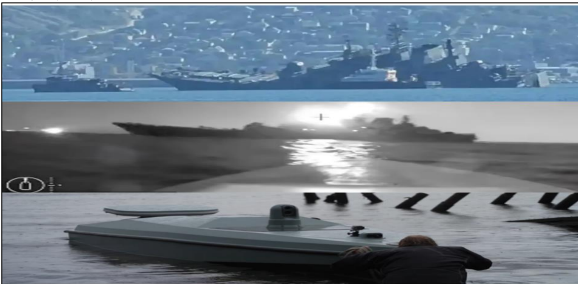
Figura 7. USV Ucraniano de Ataque de cuarta generación kamikaze clase Magura V5 empleado en el ataque al RFS Olenegorsky Gornyak el 4/8/2023