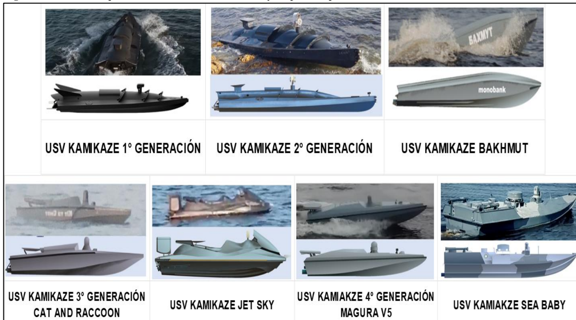
Figura 3. USV de ataque clase Kamikaze desarrollados y empleados por Ucrania