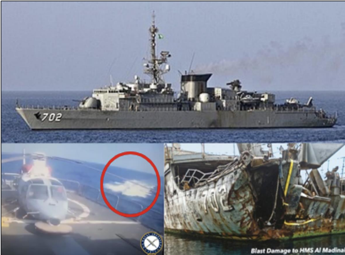
Figura 5. Daños ocasionados por un USV kamikaze a la Fragata Al Madinah