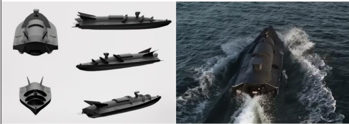
Figura 2. USV Ucraniano de Ataque Kamikaze de primera generación (usados en los ataques del 29/10/22 y 18/11/22)