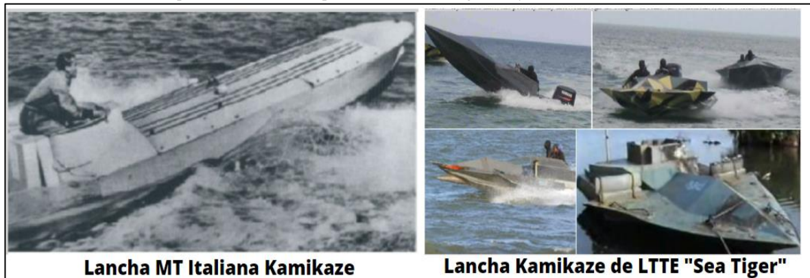
Figura 4. Vehículos de superficie Kamikaze empleados en diferentes guerras y conflictos bélicos