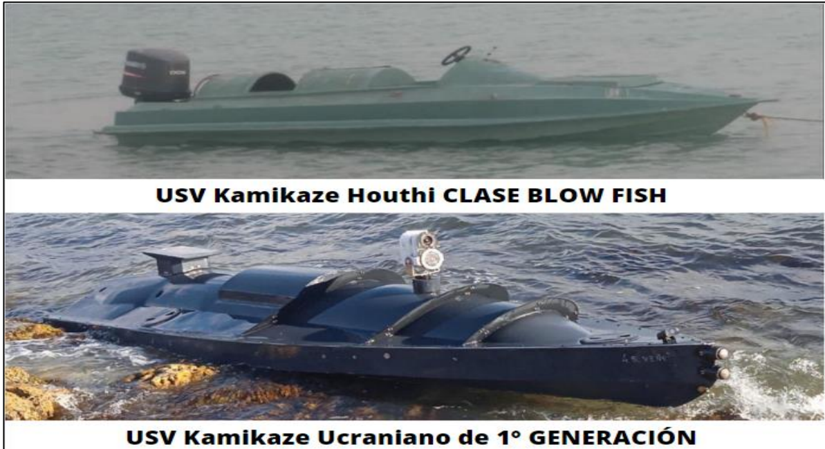
Figura 1. Comparativo de USV de ataque del grupo rebelde Houthi vs Armada Ucraniana