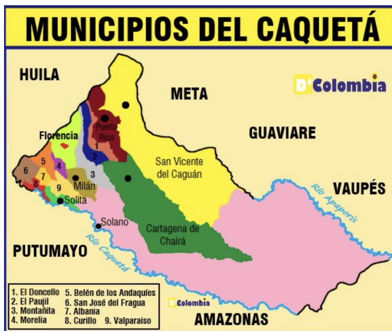
Ilustración 1. Mapa municipios del Departamento del Caquetá.

Las empresas de transporte de encomienda y turismo fueron fuertemente afectadas por la pandemia y las medidas de contención determinadas por el Gobierno Nacional y las autoridades locales. El personal que laboraba en estas agencias se redujo en un 90%. En algunos casos, las empresas quebraron en su totalidad (Rincón & otros, 2022). Además, producto del COVID-19 el desempleo del Departamento aumentó de 9,1% a 16,1% de acuerdo con datos oficiales de cierre de vigencia 2021 (Ministerio de Comercio, Industria y Turismo, 2024).