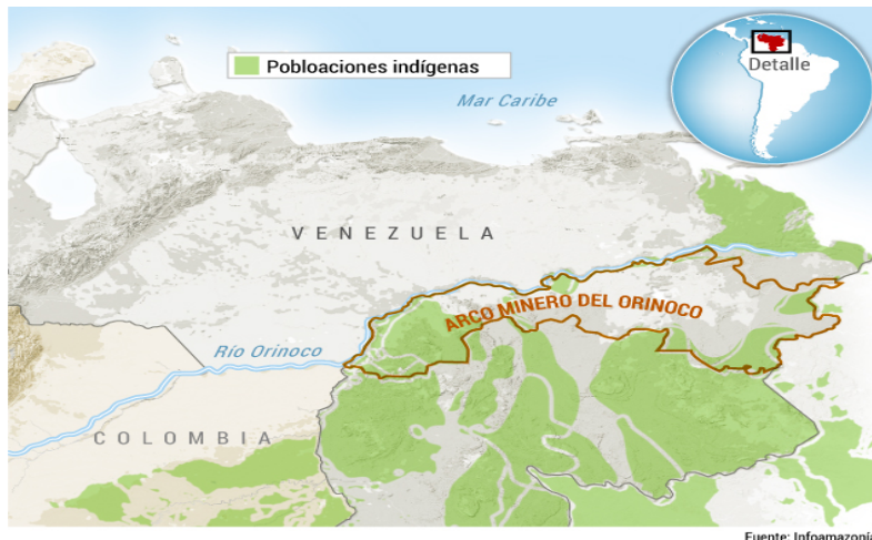
Figura 1. Ubicación Geográfica del Arco Minero del Orinoco

Nota. Fuente: (Flores & Sidorovas, 2020)