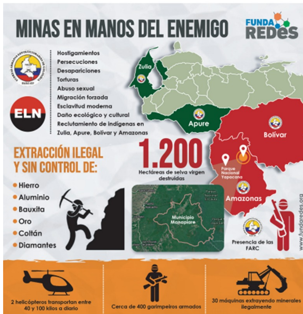
Figura 2. Minas en manos del enemigo

de las crisis humanitarias locales, lo que evidencia la fragilidad de la presencia estatal y su incapacidad para ejercer un monopolio legítimo de la fuerza.