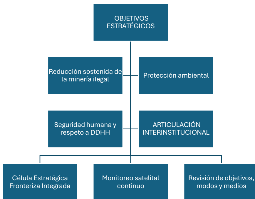
Figura 3. Objetivos Estratégicos

Para alinear la ecuación estratégica de Lykke y Sánchez con el desafío de la minería ilegal en la frontera colombo-venezolana, se propone una articulación interinstitucional que parta de objetivos políticos claros, como la reducción sostenida de la extracción ilegal, la protección ambiental y la garantía de seguridad humana para las comunidades locales. Estas metas deben ser entendidas desde un enfoque multidimensional del riesgo: social, económico, sanitario y ambiental. Por ejemplo, la creación de una "célula estratégica fronteriza integraría agentes de la Policía Nacional, CTI, fiscalía ambiental, Ministerio de Minas, autoridades étnicas e internacionalidad (OEA, IDB), permitiendo un monitoreo permanente y la definición de acciones en tiempo real(C. Álvarez et al., 2017).