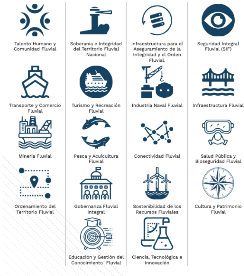
Figura 15. Intereses Fluviales de Colombia (IFC)