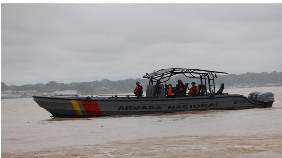
Figura 8. Unidad de Reacción Rápida (URR) tipo 380X