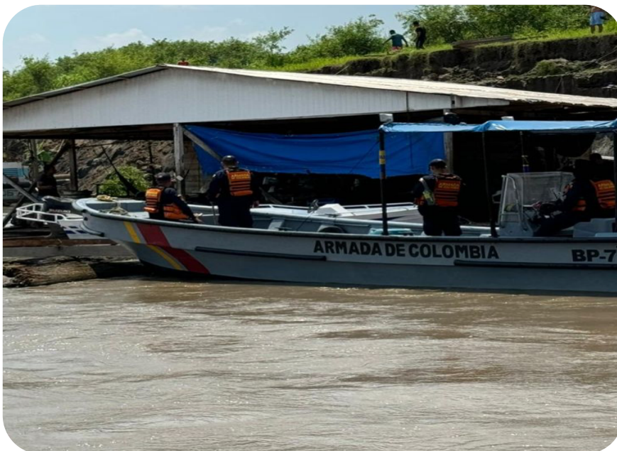
Figura 10. Unidad de Reacción Rápida (URR) tipo Langostera