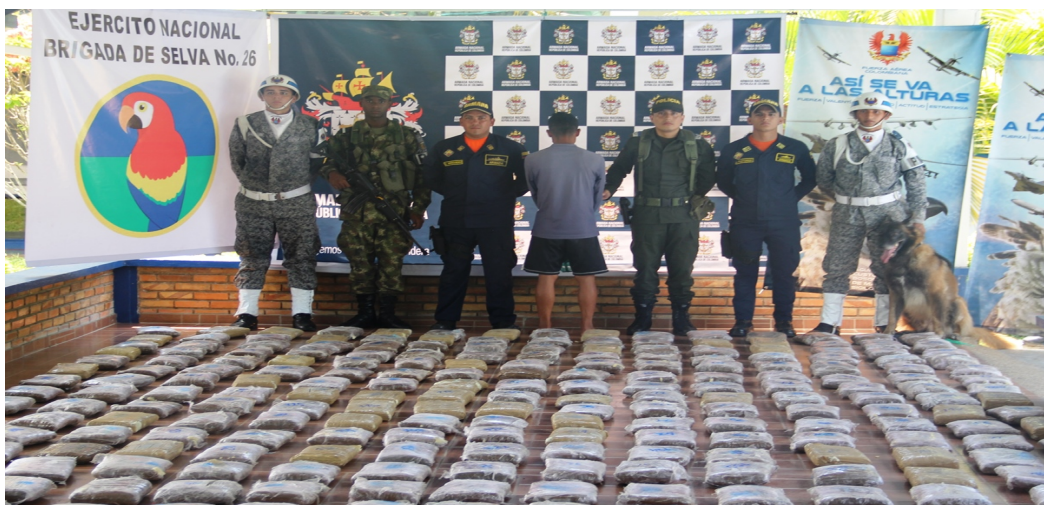
Figura 17. Resultado operacional del Comando de Guardacostas del Amazonas, incautación de 291 Kg de marihuana. Año 2016.