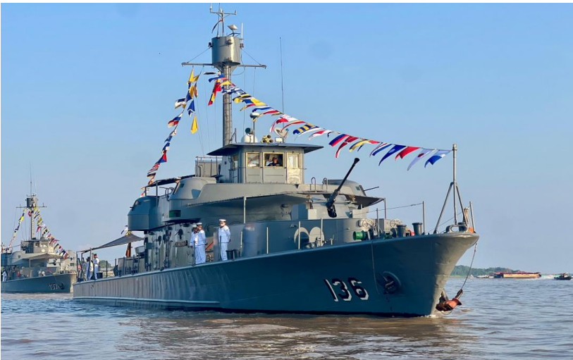
Figura 4. Cañonero Fluvial ARC "LETICIA"