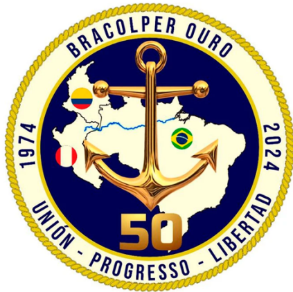
Figura 11. Operación Internacional BRACOLPER OURO 2024

Fuente: La operación BRACOLPER cumplió 50 años ofreciendo seguridad en la región amazónica.