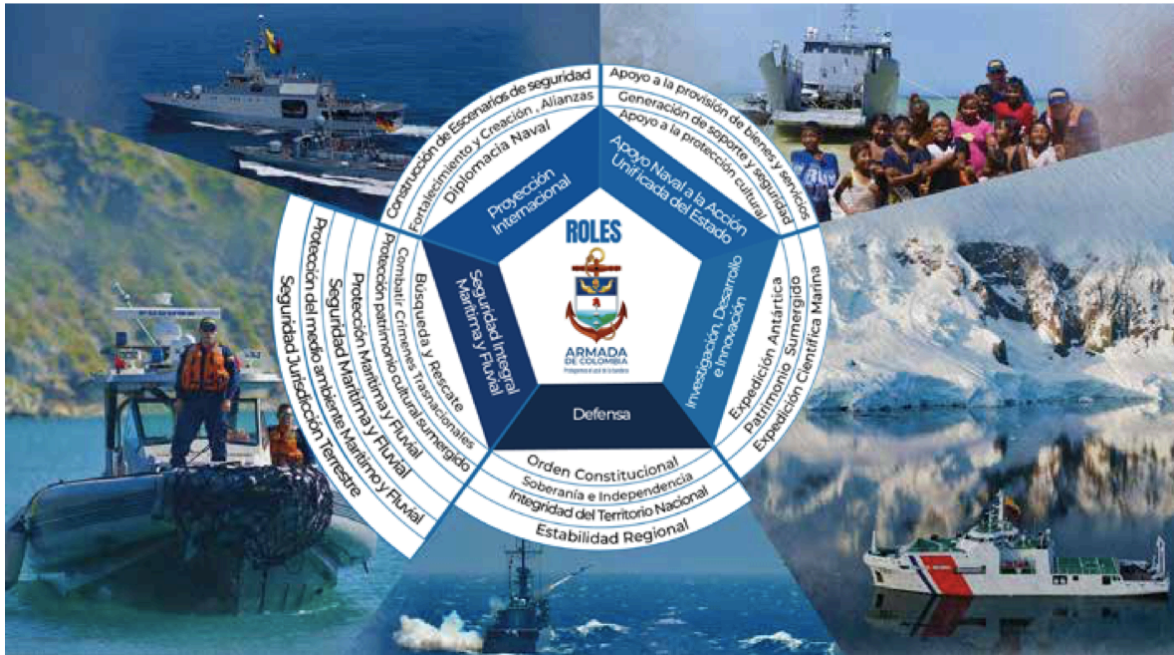
Figura 2. Pentágono de Roles y funciones de la Armada de Colombia.