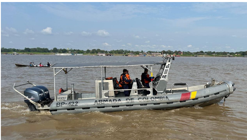
Figura 9. Unidad de Reacción Rápida (URR) tipo F