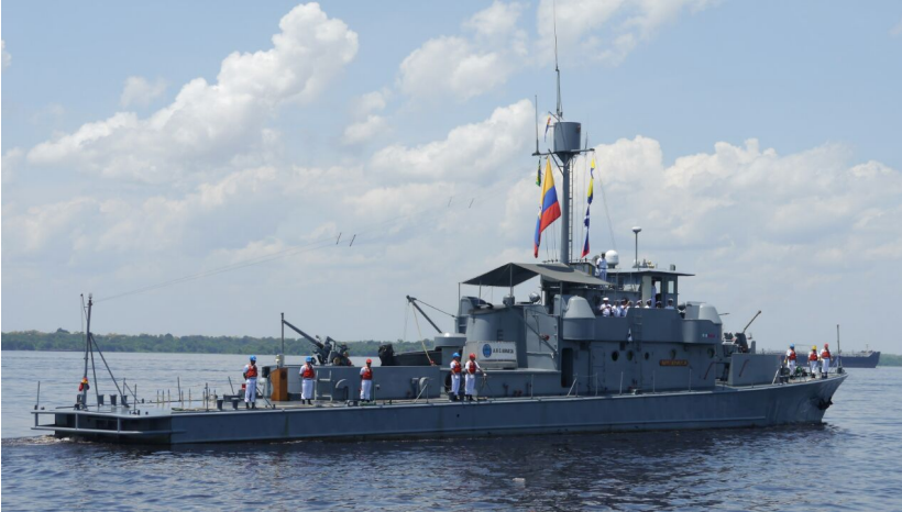
Figura 3. Cañonero Fluvial ARC "ARAUCA"

Rápida del Comando de Guardacostas del Amazonas las cuales son las destinadas en el Rio Amazonas para la lucha contra el Narcotráfico así: