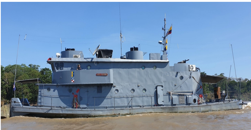
Figura 7. Patrullera Fluvial ARC “COTHUE”

Escuela Superior de Guerra “General Rafael Reyes Prieto” Bogotá D.C., Colombia