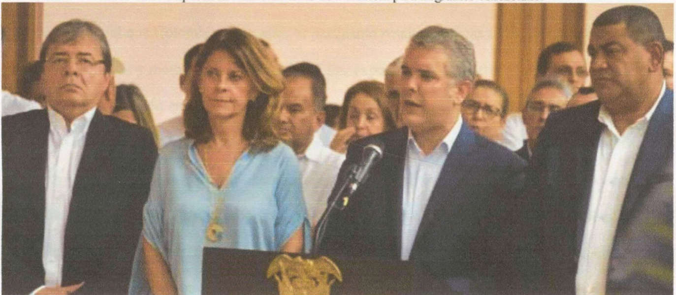
Gráfica 3- Exposición financiamiento de Colombia para migrantes venezolanos

Para el desarrollo de las estrategias anteriores, el Departamento Nacional de Planeación (2019) indica que se disponen de $712 mil millones, distribuidos en $300 mil millones para créditos productivos, $60 mil millones en inversiones al sistema de salud, $237 mil millones para el sistema general de regalías, logrando desarrollo de obras de alto impacto especialmente en aquellas zonas donde la crisis migratoria es más notoria, siendo el departamento de Norte de Santander una de las regiones que directamente asume una ayuda de $41 mil millones de estos recursos. Asimismo, se busca ampliar la oportunidad de emprendimiento y empleos apoyados por un recurso de aproximadamente $2.000 millones de pesos.