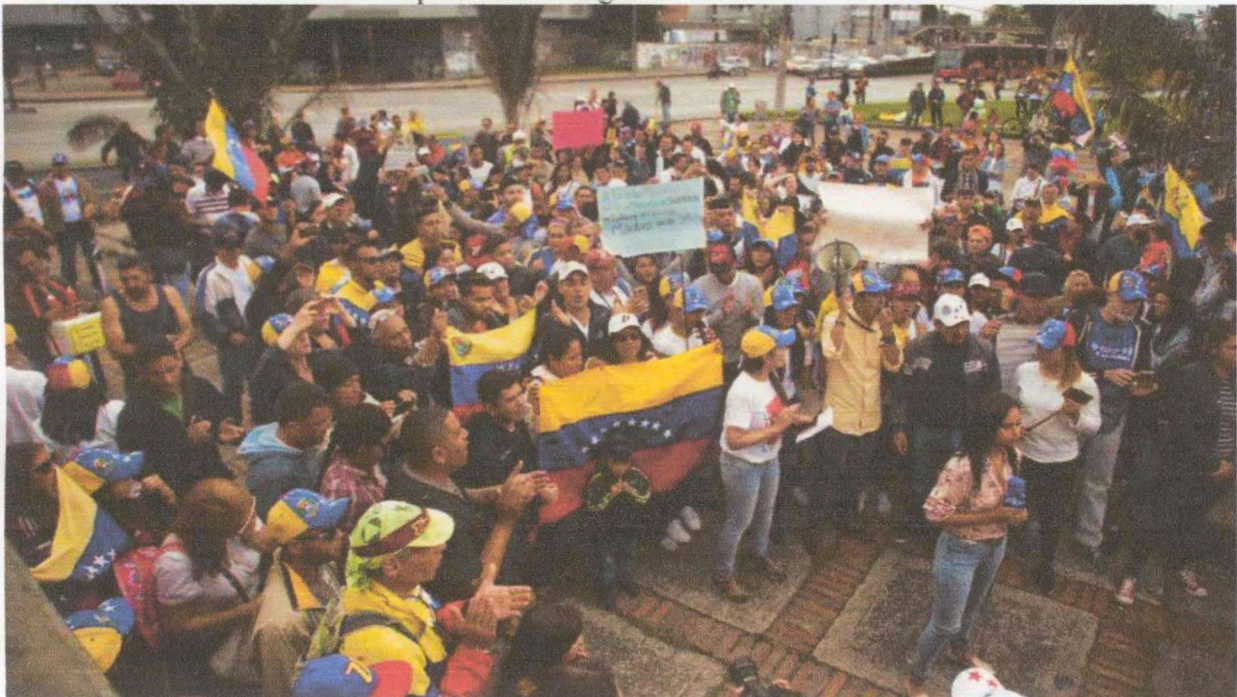
Grafica 1- Representación Migrantes venezolanos en Colombia

De acuerdo con Izquierdo (2010), la frontera entre Venezuela y Colombia es de las más dinámicas a nivel mundial, pero en los últimos años esta se ha dinamizado sustancialmente debido a la situación de orden social y económica venezolana, además de la fluctuación política e institucional, logrando que la población se vea forzada a sobrevivir en otros territorios, mayoritariamente por medio de la migración con la frontera colombiana. Esta situación abarca varias problemáticas, sin embargo, se tiene concentración principal en los campos de seguridad, integridad y soberanía.