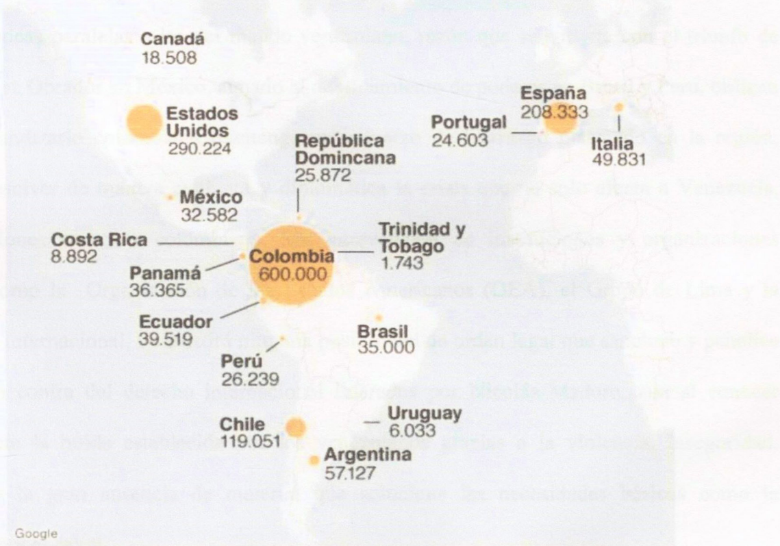
Gráfica 4- Número de migrantes venezolanos por nación (aproximados)

En cambio, la nación costarricense expone el Consejo Nacional de Migración (2017), que su Estado mantiene una estrategia donde institucionalmente se gestiona una adecuada acción migratoria, respetando los índices de seguridad, convivencia y derechos humanos; esta acción es posible y acertada, el Consejo Nacional de Migración (2017) indicaba que la cantidad de migrantes venezolanos solo comprende 1.389 individuos, cantidad que no compromete de manera significativa la integralidad de la nación. No obstante, un Estado como Perú mantiene una población de migrantes de casi 800.000 individuos, siendo una nación que sigue en números a la colombiana; gracias a esto, el actual mandatario peruano Martin Vizcarra asume una posición severa y estricta para la manutención de esta población en la nación, pues ha generado expulsiones masivas de venezolanos que llegan a la nación de manera irregular, exigiendo además la visa humanitaria establecida para garantizar la seguridad de los ciudadanos peruanos.