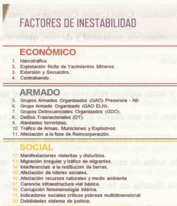
Factores de Inestabilidad